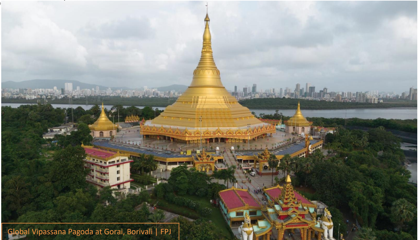
Global Vipassana Pagoda at Gorai, Borivali